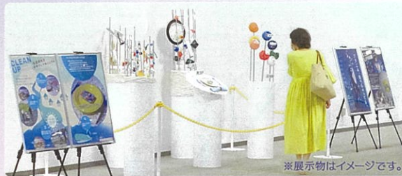
※展示物はイメージです。